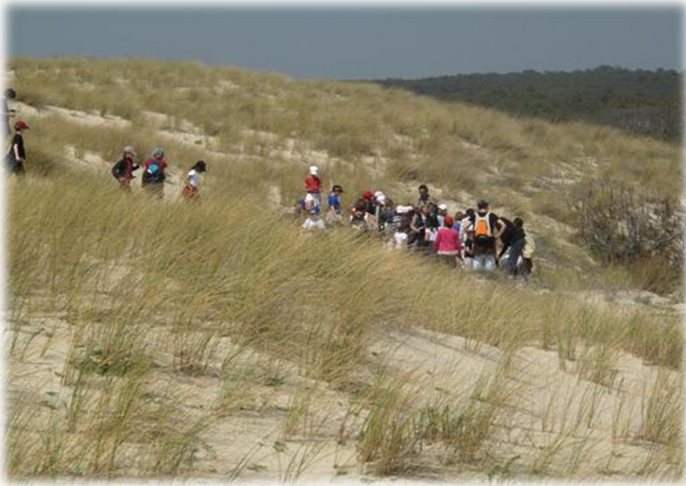
Découverte de la dune