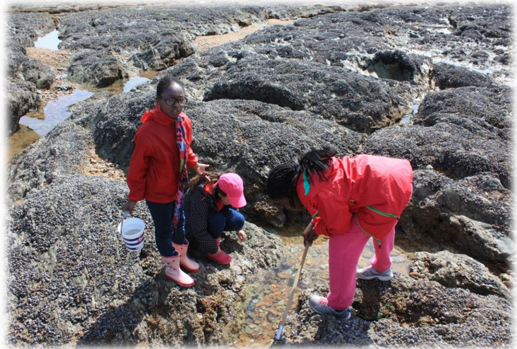
Pêche à pieds